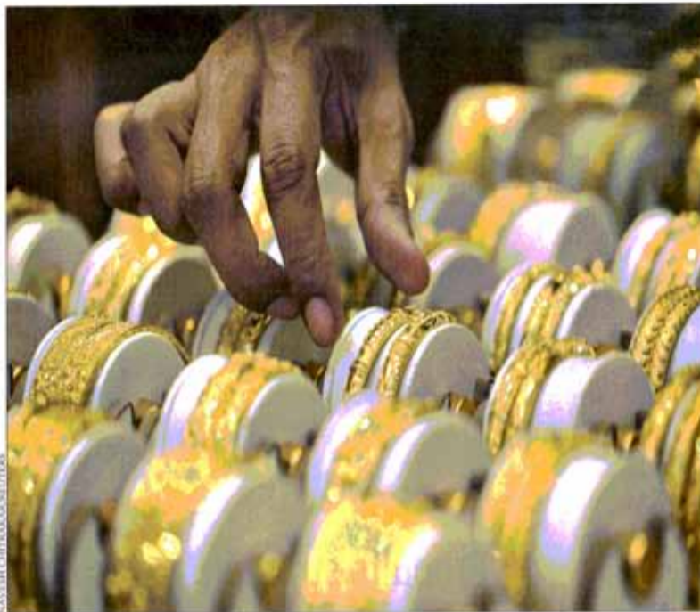
L'Inde représente le plus important acheteur d'or physique au monde.

De son côté, l'Inde – le plus important acheteur d'or physi-